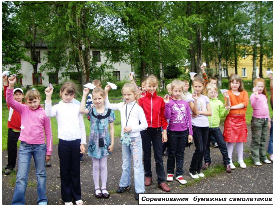
Соревнования бумажных самолетиков

Лето – пора, которую с нетерпением ждут и дети, и взрослые. Лето – время радости, веселья, смеха и, конечно, отдыха. Для того, чтобы ребята провели этот период с пользой для души и тела, в нашей школе работал лагерь «Веселые каникулы».