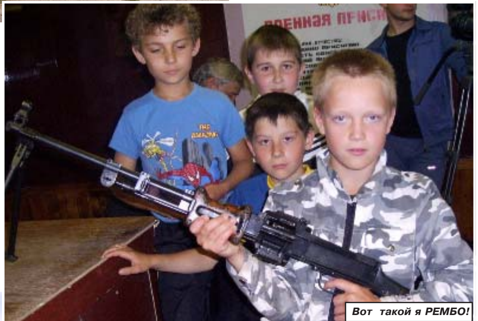
Вот такой я РЕМБО!