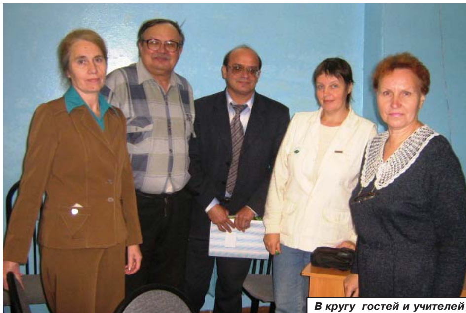
В кругу гостей и учителей