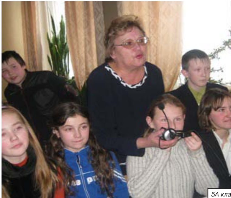
5А класс нашей школы

Начался телемост с поздравлений друг друга с Днем освобождения города Нелидова от фашистов и Татьяниним днем – праздником студентов.