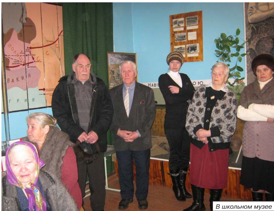
В школьном музее