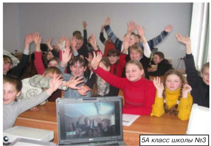
5А класс школы №3

Хочется надеяться, что это мероприятие поможет сориентироваться в дорожной ситуации и расширит знания