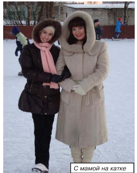
С мамой на катке

В один чудесный день мы с друзьями и моей мамой собрались пойти на каток. Мама решительно надела коньки и стала добираться до катка. В этот момент я была рядом и держала её за руку. Мама, крепко держась за бортик,