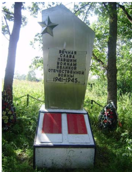
д. Дятлово. Захоронено 115 человек (все имена погребенных известны), погибших в 1941-1943 гг. Памятник установлен в 1985 году.