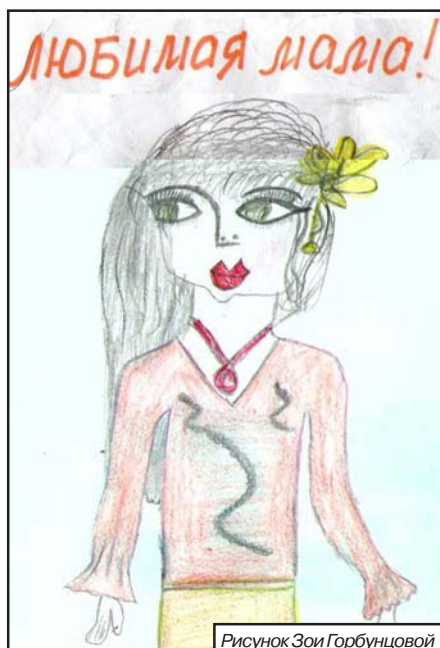
Рисунок Зои Горбунцовой