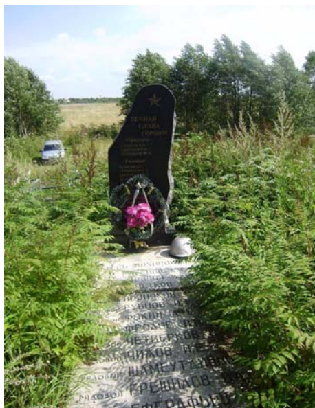
д. Подберезье. Захоронено 15 человек, погибших в 1942 году. Памятник установлен в 1985 году, новый переустановлен в 2009 году.

Через полгода наша страна будет праздновать знаменательный юбилей – 65 годовщину Победы в той кровавой войне. Время идет, но память о погибших навсегда останется в людской памяти. Группа учащихся старших классов начала собирать материал о мемориалах и захоронениях на территории нашего района. С ними мы и будем знакомить вас со страниц нашей газеты.