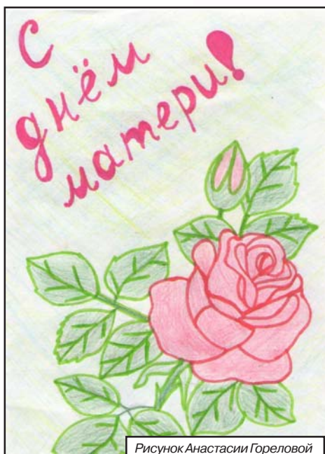
Рисунок Анастасии Гореловой