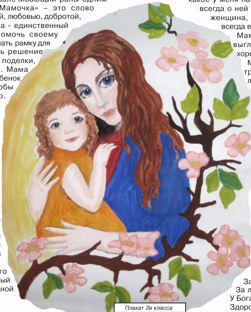
Плакат 2в класса