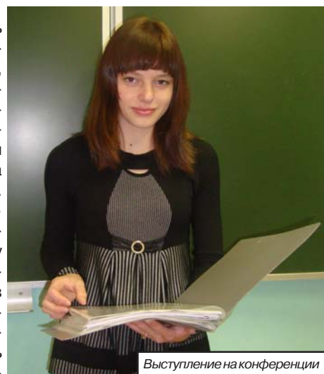
Выступление на конференции

Работа велась по четырем секциям — исторической, краеведения, военной истории, православного краеведения. Я, с работой «Моя малая родина — деревня Каденка. Экология. Культура. Быт», представляла нашу школу и Нелидовский район. Попав на секцию краеведения, мне довелось услышать много разнообразных выступлений, посвященных родному краю, школе, деревне, улицам и паркам городов нашей области. Было здорово! Интересно было и общение со своими сверстниками из других городов.