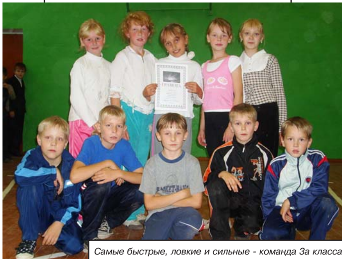
Самые быстрые, ловкие и сильные - команда 3а класса