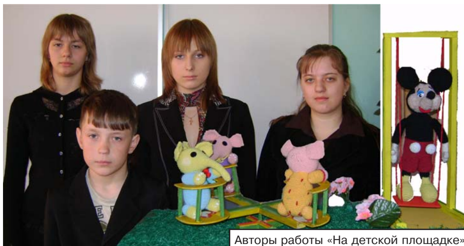
Авторы работы «На детской площадке»