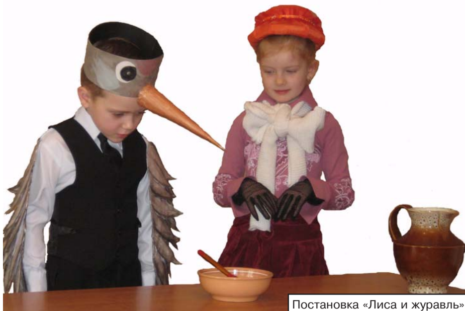
Постановка «Лиса и журавль»

Вот и подошел к финалу конкурс юных талантов «Созвездие». Самый популярный фестиваль молодых дарований открылся и завершился традиционно во Дворце Культуры Шахтера.