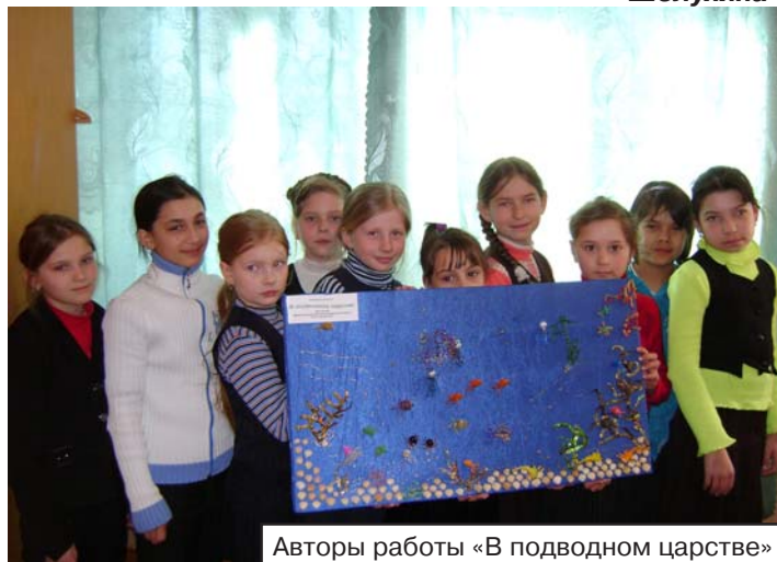
Авторы работы «В подводном царстве»