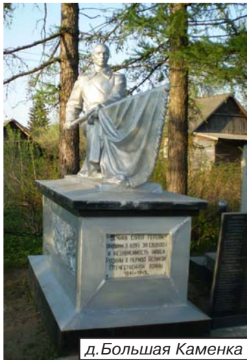
д. Большая Каменка