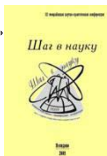
Выпущен сборник тезисов