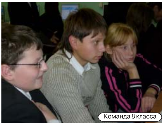
Команда 8 класса

18 сентября команды 7 и 8 классов приняли участие в интернет-олимпиаде по математике. Она длилась полтора часа, и за это время нам предстояло справиться с двадцатью заданиями. Задания были разной сложности, мы не успели решить только одно. В итоге наша команда набрала 29 баллов, решив