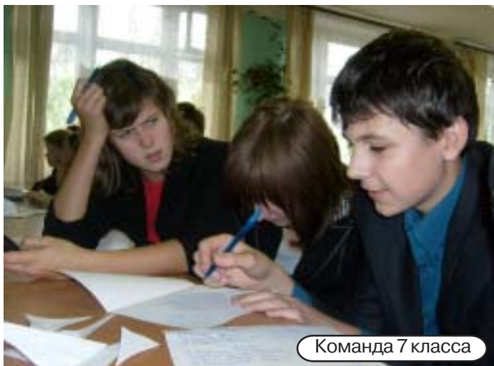
Команда 7 класса